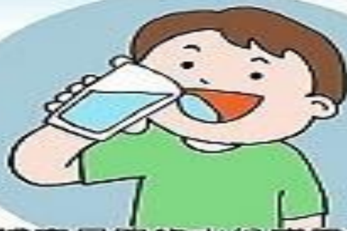
2. 補充足夠的水份或電解質 和葡萄糖之補充劑