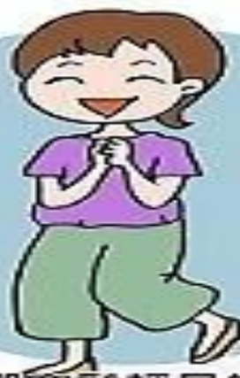
4. 挑選寬鬆輕量的穿著