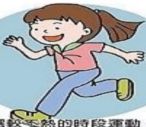
3. 選較不熱的時段運動 適時在陰涼處稍作休息